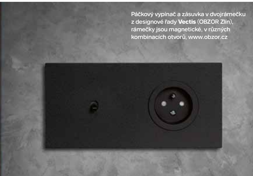
Páčkový vypínač a zásuvka v dvojrámečku z designové řady Vectis (OBZOR Zlín), rámečky jsou magnetické, v různých kombinacích otvorů, www.obzor.cz